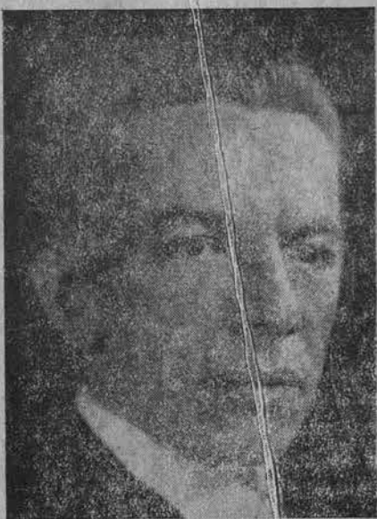
DR. HARMODIO ARIAS M.

Personificación de los ideales de la Revolución. Eminente hombre público y patriota panameño.